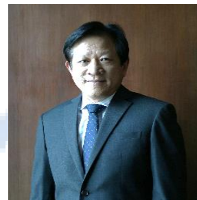
นายจิรวุฒิ ไพศาลศรีศิลป์ อุปนายก